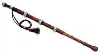
Flet afrykański poprzeczny