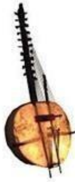
Kora (afrykańska harfa) –pickup - jack > Ngoni jest bardzo podobnym instrumentem.