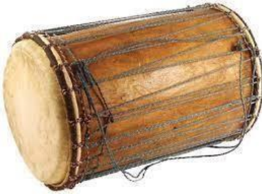
Bęben basowy z dzwonkiem DUNDUN