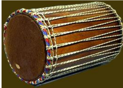
Bęben basowy z dzwonkiem SANGBAN