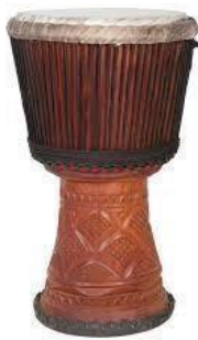
Djembe x 4