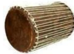
Bęben basowy z dzwonkiem KENKENI